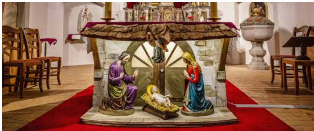
Der neue Krippenstall passt perfekt in den Chor der Kirche / Le nouveau décor de la crèche s'intègre parfaitement dans le chœur de l'église.