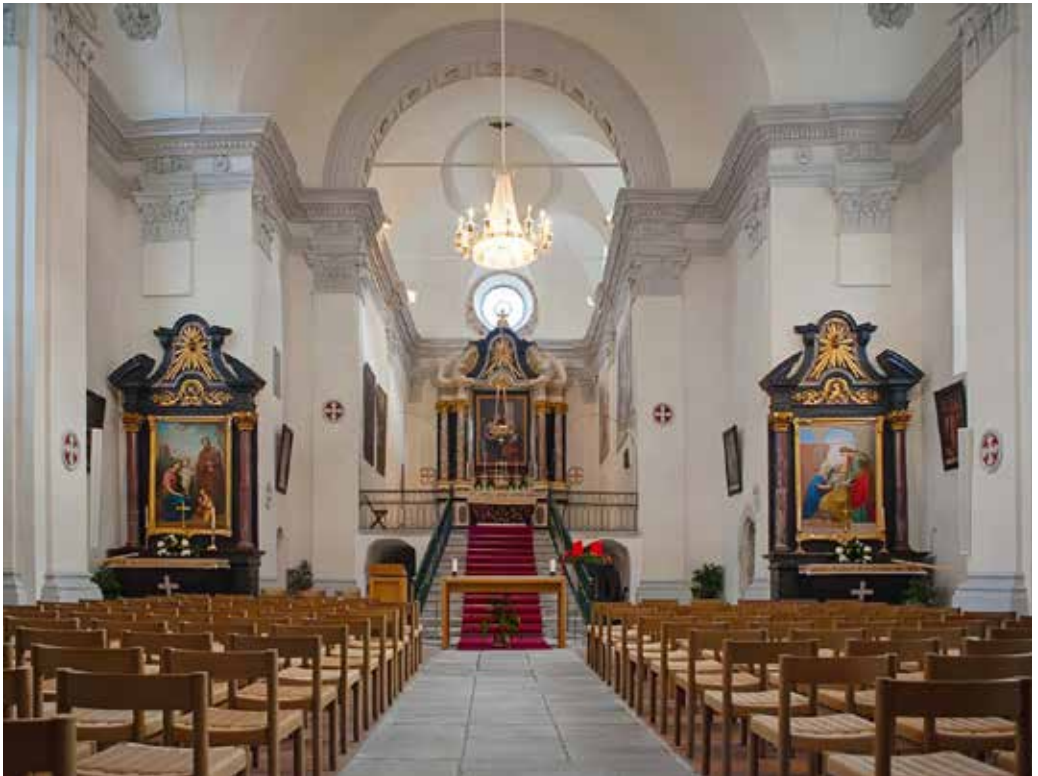
Innenansicht der Dreikönigskirche / Vue intérieure de l'église des Trois-Rois

de clarifier au préalable les termes utilisés lors de la conclusion de contrats, que ce soit autrefois ou aujourd'hui. Alors que les Savoyards définissaient le « lever du soleil » comme le moment où le soleil est visible dans le ciel, les Haut-Valaisans reprirent les hostilités avant l'aube et attaquèrent l'armée ennemie pendant son sommeil. Beaucoup périrent dans leurs campements ou furent tués sans défense, et seul Rodolphe de Gruyère et quelques fidèles parvinrent à s'enfuir en traversant le pont de la Vispa.