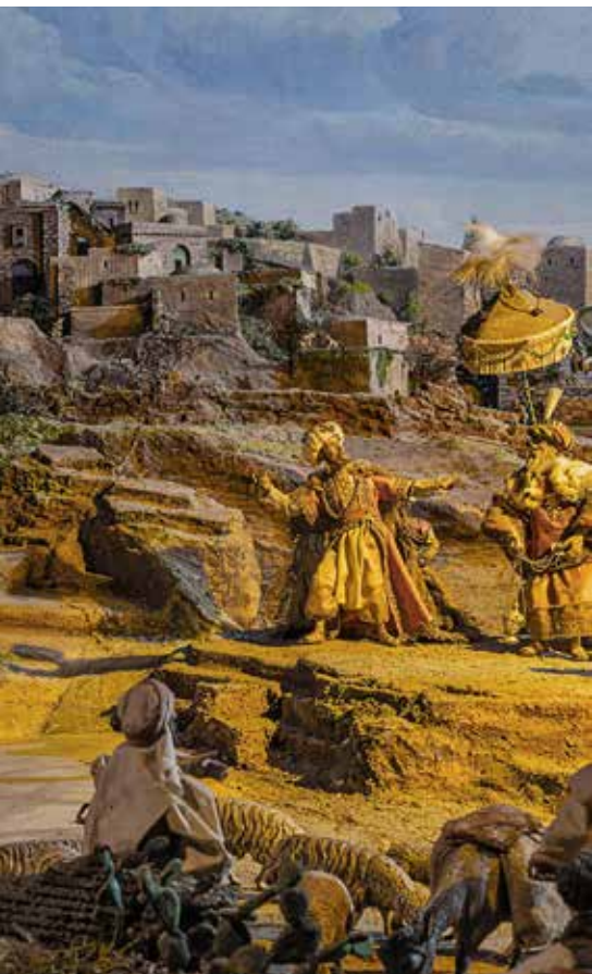
Anbetung der Hirten im Diorama in Einsiedeln / Adoration des bergers dans le diorama à Einsiedeln