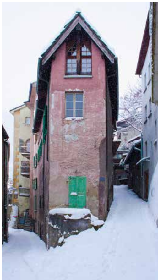
Winterliche Stimmung in der romantischen Visper Altstadt/ Ambiance hivernale dans la vieille ville pittoresque de Viège