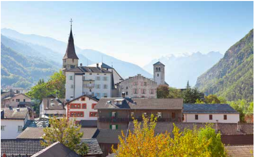
Südansicht von Visp / Vue sud sur Viège

Die Waffenruhe galt bis zum Sonnenaufgang am Mittwoch, dem 23. Dezember. Und es zeigt sich, dass es bei Vertragsabschlüssen – ob in früheren Zeiten oder heute – wichtig ist, die darin verwendeten Begriffe vorher abzuklären. Während die Savoyer «Sonnenaufgang» als den Zeitpunkt definierten, an dem die Sonne am Himmel zu sehen ist, begannen die Oberwalliser bereits vor dem Morgengrauen wieder mit kriegerischen Handlungen und überrumpelten das feindliche Heer im Schläfe. Viele verbrannten in ihren Nachtlagern oder wurden wehrlos erschlagen, und nur mit Mühe gelang Rudolf von Greyerz und einigen Getreuen die Flucht über die Brücke der Vispa.