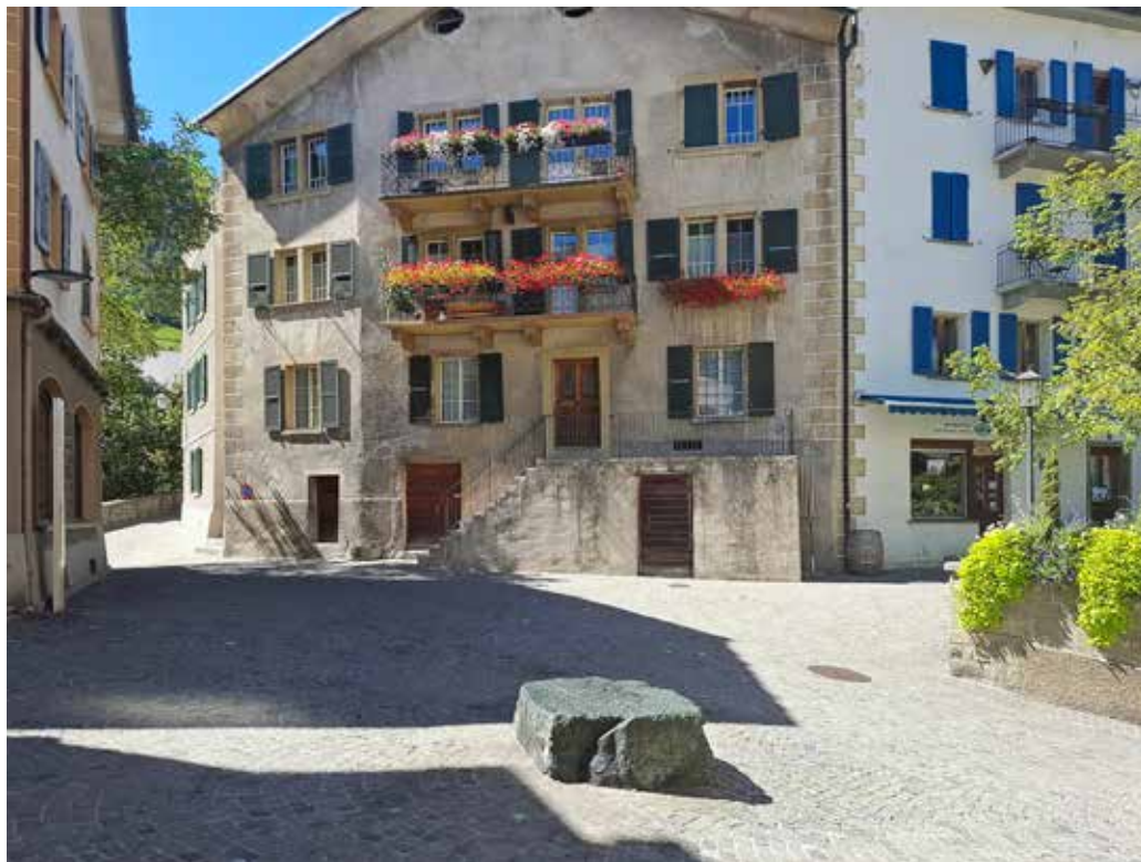
Der bekannte «Blaue Stein» in der Visper Altstadt / La fameuse « pierre bleue » dans la vieille ville de Viège

Le Haut-Valais, avec ses cols de montagne, notamment le Simplon, qui mènent au sud, a suscité la convoitise d'autres régions. Les comtes de Savoie menaient une politique d'expansion agressive et cherchaient à restreindre les droits des dizains (subdivisions autonomes) du Haut-Valais. À la fin de l'automne 1388, une grande armée savoyarde dirigée par Rodolphe IV, comte de Gruyère, se mit en marche vers le Haut-Valais. Elle était bien équipée, aguerrie et largement supérieure en nombre aux