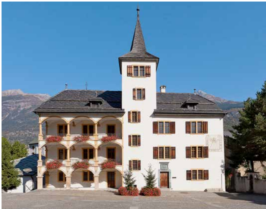
Das imposante Burgener-Haus / L'imposante maison Burgener