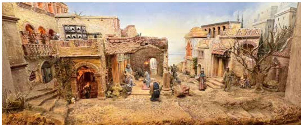
Eines der fertigen Dioramen / L'un des dioramas terminés